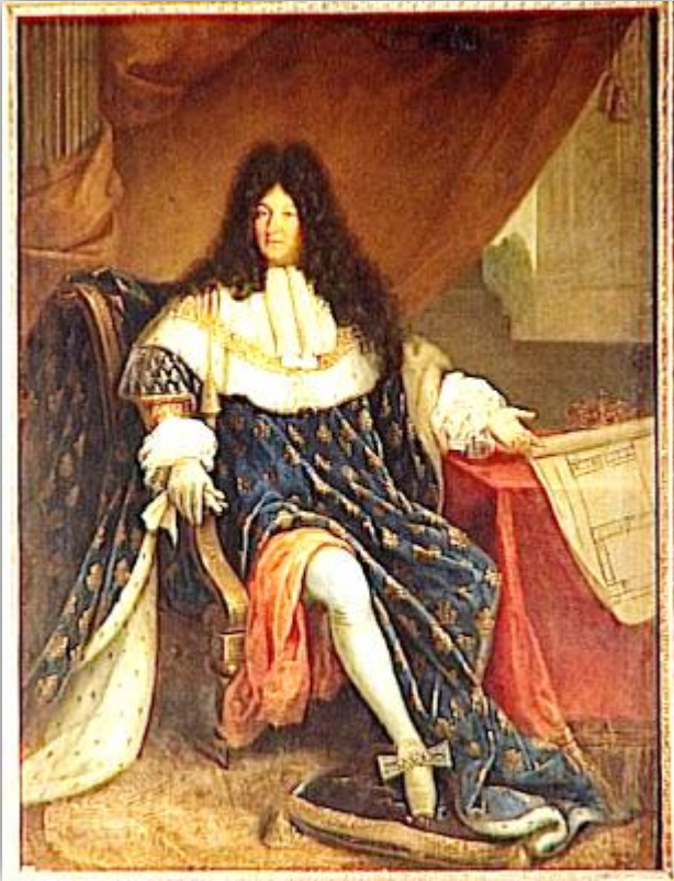
Doc 2 : Le roi Louis XIV