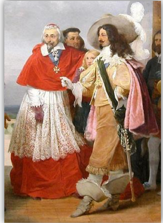
Doc 1 : Louis XIII et Richelieu