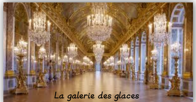
La galerie des glaces